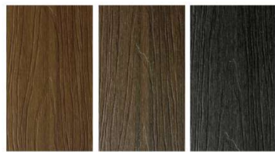
Golden Teak GE-16, Smoky Brown GE-17, Black Oak GE-07