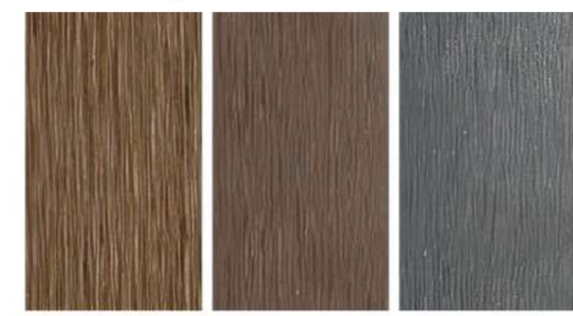
C02, C119, C109